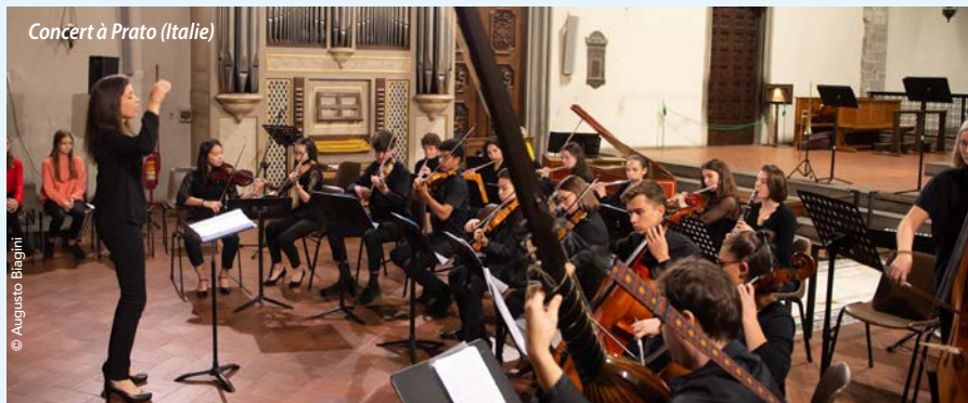
Concert à Prato (Italie)

L'action du Conservatoire Jacqueline-Robin est soutenue par la DRAC Île-de-France (Ministère de la Culture), la Région Île-de-France, le Département du Val-d'Oise, la Caisse d'Allocations Familiales (CAF), et l'association « Orchestre à l'école ».