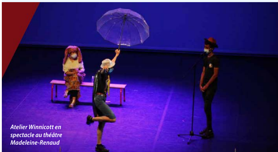
Atelier Winnicott en spectacle au théâtre Madeleine-Renaud

De la 6 e à la 3 e les CHAM offrent un enseignement musical renforcé au collège et un aménagement d'horaires pour faciliter les études au conservatoire. Il s'agit d'une CHAM instrumentale. Accès sur dossier et entretien.