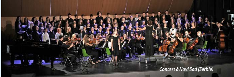
Concert à Novi Sad (Serbie)

Mise en réseau des conservatoires et écoles de musique d'Eaubonne, Le Plessis-Bouchard, Saint-Leu-la-Forêt et Taverny, en partenariat avec le département du Val-d'Oise. Stages et concerts d'harmonies.