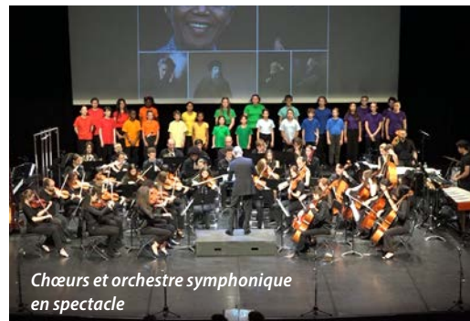
Chœurs et orchestre symphonique en spectacle

Par leur capacité à développer la motivation et les compétences des élèves, leur potentiel de créativité et de pluridisciplinarité, leur implication dans la vie culturelle locale et leur convivialité, elles sont au cœur du projet du conservatoire.