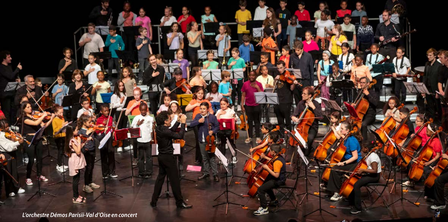
L'orchestre Démon Parisii-Val d'Oise en concert