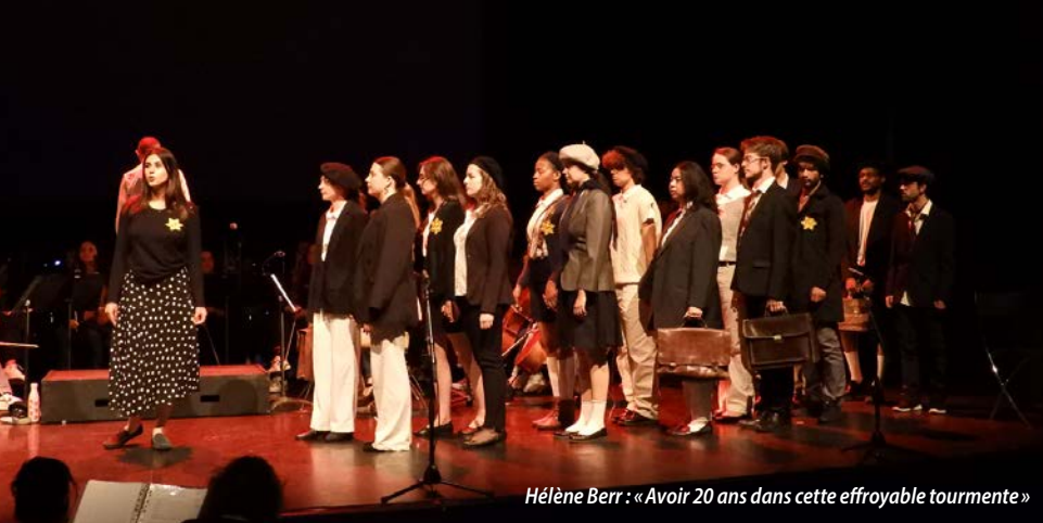
Hélène Berr : « Avoir 20 ans dans cette effroyable tourmente »