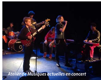
Atelier de Musiques actuelles en concert

Le conservatoire Jacqueline-Robin adhère à l'association MESH. Par cette démarche, il s'engage à favoriser la pratique de la musique pour les personnes en situation de handicap et à promouvoir le « réseau musique et handicap Val-d'Oise ».