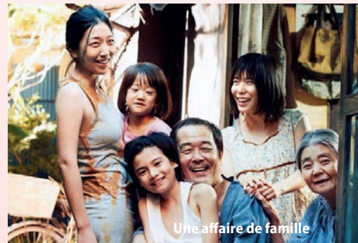
Une affaire de famille

Au retour d'une nouvelle expédition de vol à l'étranger, Osamu et son fils recueillent dans la rue