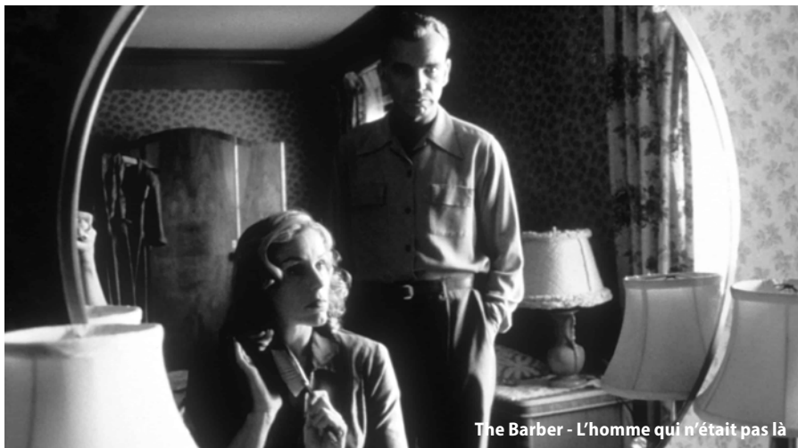
The Barber - L'homme qui n'était pas là

Un polar haletant qui ne manque pas d'humour noir.