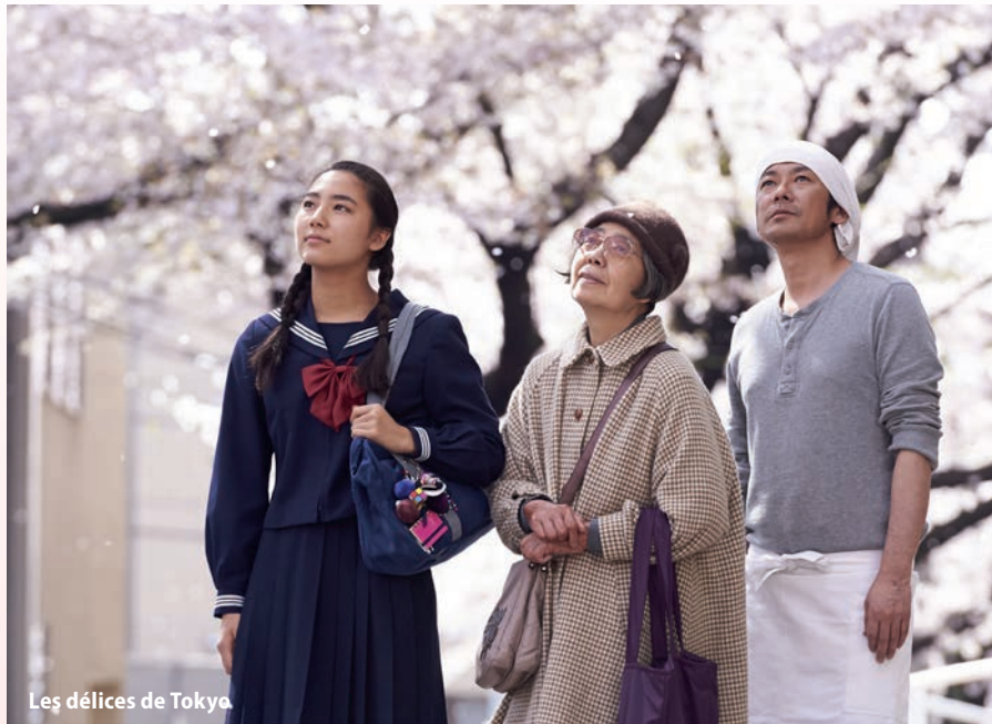
Les délices de Tokyo

Entre polar et drame intimiste, un classique du cinéma japonais contemporain et l'un des meilleurs films de Takeshi Kitano.