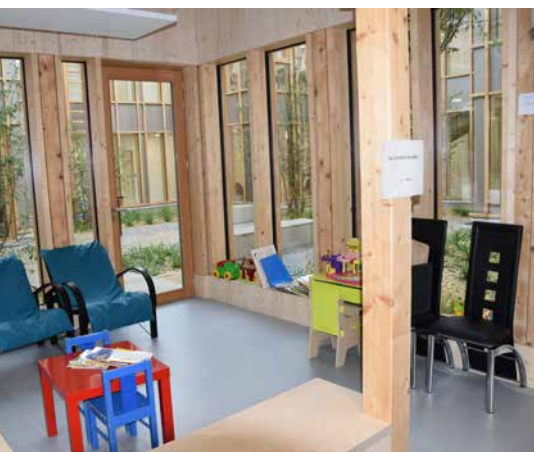
Salle d'attente du pédiatre

Véritable espace vert de détente, tous les sens seront sollicités avec notamment la présence de plantes médicinales odorantes comme le romarin, la camomille, mélisse citronnelle, sauge officinale, Thym, Verveine, Astragale, guimauve... et des vivaces (Gaura rose de Lindheimer, Pentstemon, Sauge de Russie, Euphorbia japonica, Geranium macrorrhizum, Rosier innocencia).