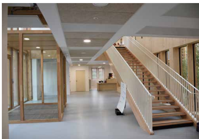
Hall d'accueil des généralistes

Avec 17 praticiens de santé, le pôle affiche complet et a permis d'attirer de nouveaux praticiens à l'image du pédiatre, du gynécologue et d'une médecin généraliste, tous trois hors secteur et qui voient en cette structure, organisée et pluridisciplinaire, une facilité d'exercer la médecine.