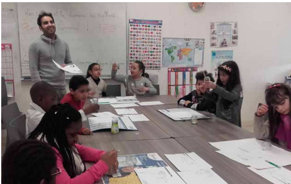
Une séance aide aux devoirs (CLAS)

La Ville dispose de deux espaces de proximité. Les activités sont proposées en cohérence avec le projet social de la Maison des habitants et intègrent les objectifs éducatifs du PEDT. L'accès à la Maison des habitants est soumis à un dossier d'adhésion annuel. Ils sont ouverts à tous quels que soient leurs ressources et leur lieu d'habitation.