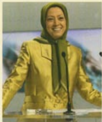
Maryam Rajavi, Présidente élue de la Résistance iranienne

En Iran et à Achraf les Iraniens se soulèvent contre la dictature des mollahs - pour la démocratie - la laïcité - l'égalité des femmes - le respect des droits de l'homme - l'abolition de la peine de mort