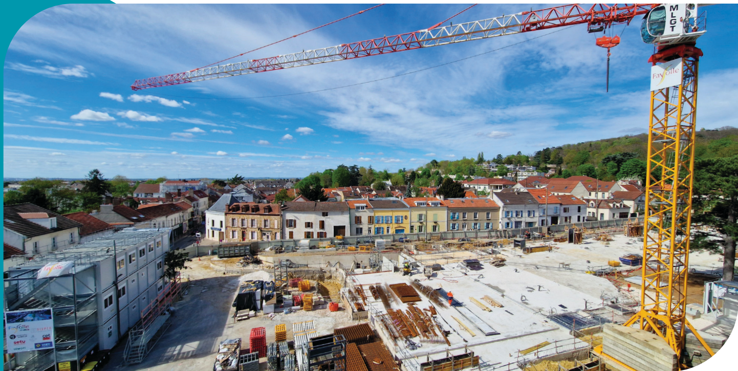
Travaux du nouveau Cœur de Ville - En cours

À terme, la place Charles-de-Gaulle sera totalement réaménagée en « place du marché » offrant une nouvelle halle s'inspirant des halles de Baltard, chef-d'œuvre de légèreté et de transparence, sur une surface d'environ 1400 m 2 , incluant un restaurant et des terrasses accessibles pour tous.