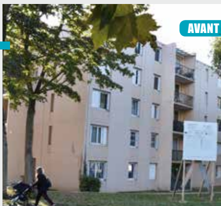
AVANT / APRÈS