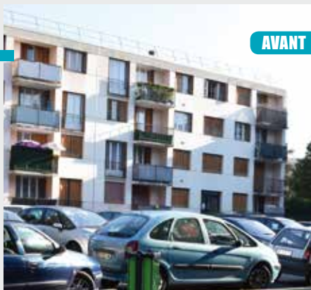
AVANT / APRÈS