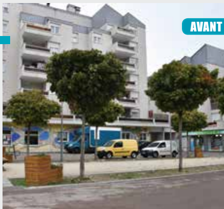
AVANT / APRÈS