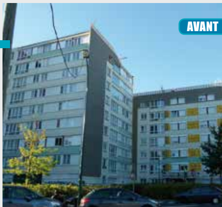
AVANT / APRÈS