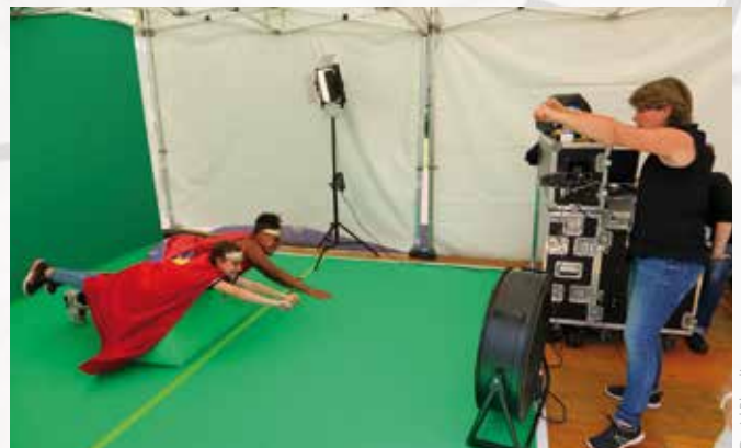
L'atelier fond vert qui a transformé le public en super-héros