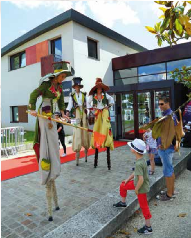
Les elfes du cinéma en déambulation