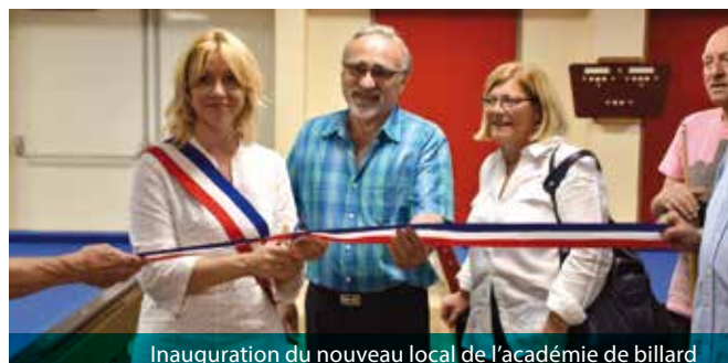
Inauguration du nouveau local de l'académie de billard

Le Billard club, qui compte à ce jour une trentaine d'adhérents,