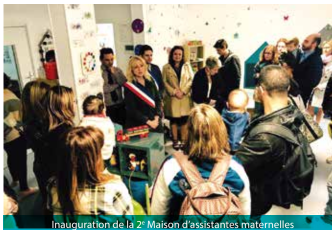
Inauguration de la 2 e Maison d'assistantes maternelles

La MAM « Rires d'enfants » est née de la volonté commune de la Ville et de l'équipe de 3 assistantes maternelles de proposer un lieu d'accueil en centre-ville (voir article page 10 Taverny Mag N°19). Pour cela, la ville a engagé d'importants travaux de réhabilitation