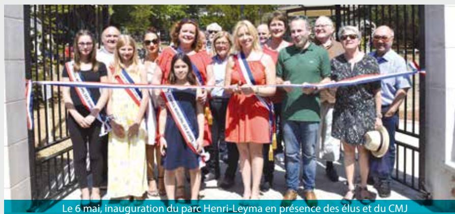
Le 6 mai, inauguration du parc Henri-Leyma en présence des élus et du CMJ