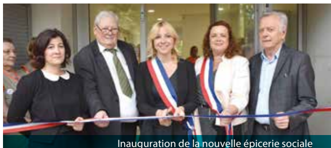
Inauguration de la nouvelle épicerie sociale

Le 28 mai dernier, Madame le Maire a inauguré la nouvelle épicerie sociale « Geneviève de Gaulle-Anthonioz », fruit d'une véritable politique municipale conjuguant l'action sociale et la solidarité. Retenue via l'appel à projets lancé par l'actuelle municipalité, la Croix-Rouge Française a pris possession des lieux dans une nouvelle structure entièrement remaniée, assainie et modernisée... et qui travaille désormais en lien avec le CCAS de la ville.