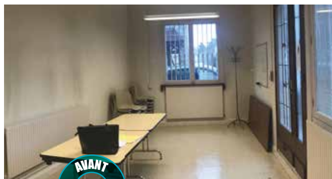
Local « classe orchestre »

Une belle façon de revaloriser les équipements vétustes du centre-ville pour progressivement redynamiser le cœur de ville, rafraîchir son image, et l'inscrire dans une dimension propice à la culture.