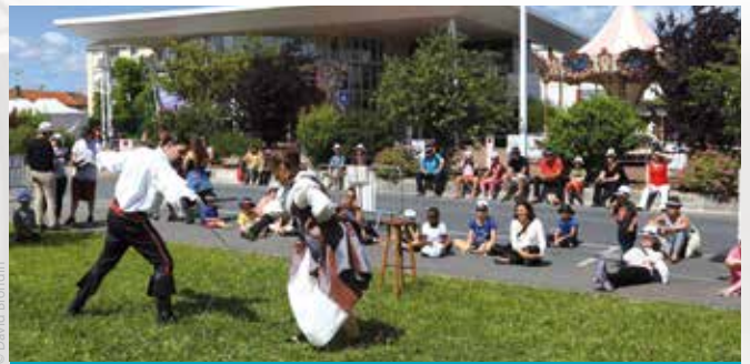
Saynettes et combats à l'épée par la Compagnie «Fleur de Lys»