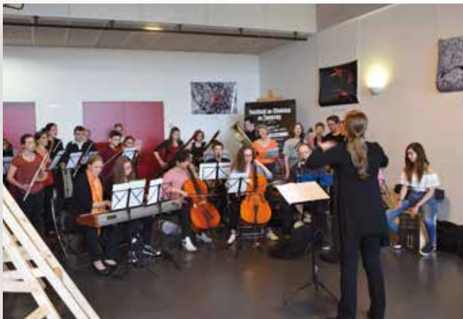
Concert d'ouverture par le lycée Jacques-Prévert