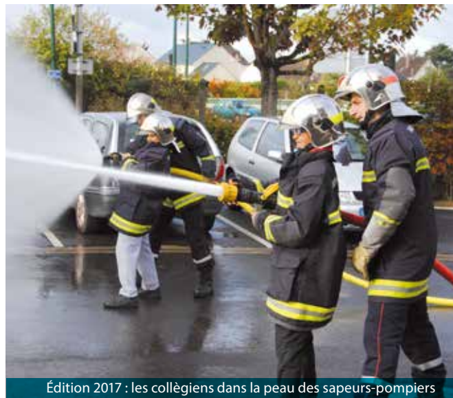
Édition 2017 : les collégiens dans la peau des sapeurs-pompiers

P rés de 300 jeunes de 6 e des collèges Georges-Brassens et Carré Sainte-Honorine constitués en équipes de 8 à 10 participants, et encadrés par leurs professeurs, vont effectuer en 3h un parcours pédestre à travers la ville en passant sur différents points d'accueil. Sur chaque étape, les élèves devront réaliser défis, épreuves, questionnaires, simulations... toutes ces activités étant destinées à les sensibiliser aux notions de respect et de citoyenneté. Plusieurs services de la ville et partenaires participent chaque année à ce projet en accueillant les jeunes dans leurs équipements. Ils se joignent à l'aventure et vont encore diversifier le parcours: sapeurs-pompiers, police municipale et nationale, Cars Lacroix, services municipaux, Tri-Action, MLC, ADPJ, etc. ■