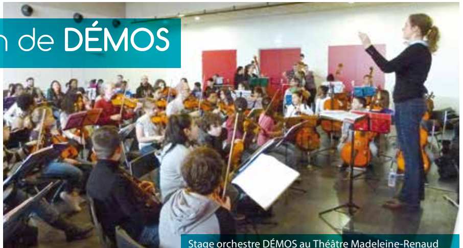
Stage orchestre DÉMOS au Théâtre Madeleine-Renaud