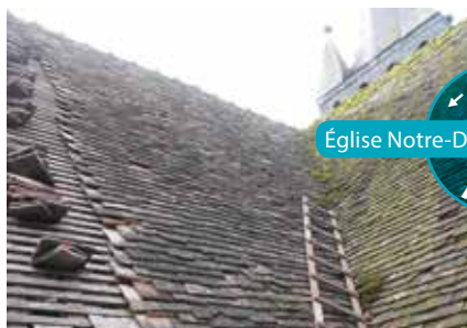
Église Notre-Dame de l'Assomption

Deux équipes ont travaillé en étroite collaboration: une équipe de cordistes