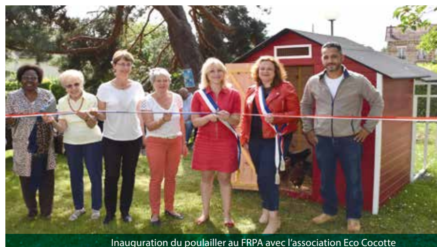
Inauguration du poulailler au FRPA avec l'association Eco Cocotte

Réputées pour leur bon caractère, un lien social peut également se créer autour des poules qui viendront animer et rythmer le quotidien des résidents.